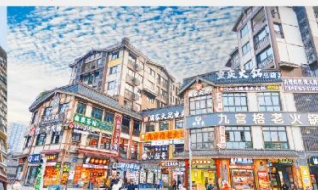
หมู่บ้านโบราณฉือซีไฮ่

*ทางบริษัทฯ ขอสงวนสิทธิ์ในการสลับโปรแกรมทัวร์ตามความเหมาะสมขึ้นอยู่กับสถานการณ์หน้างาน โดยคำนึงถึงผลประโยชน์ของลูกค้าเป็นสำคัญ