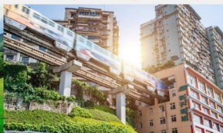
รถไฟฟ้าทะลุตีต