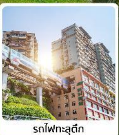
รถไฟทะเลตึก