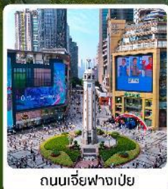
ถนนเจียฟางเป่ย์