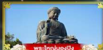
พระใหญ่ของปิง