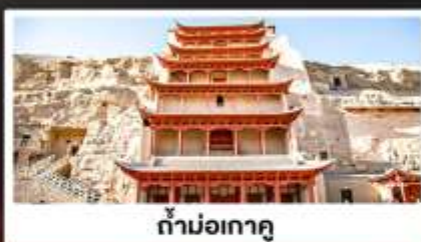
ถ้ำม่อเกาตุ