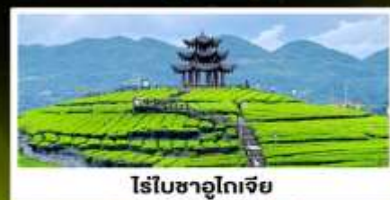
ไร่ชาอูโตเจีย