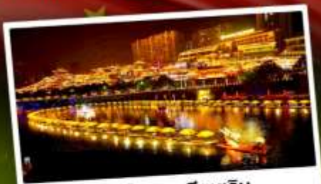
เมืองโบราณเซียนเิน