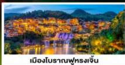
เมืองโบราณฟุทงเจิน