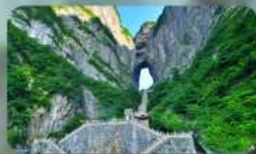
หุบเขาประตูสวรรค์