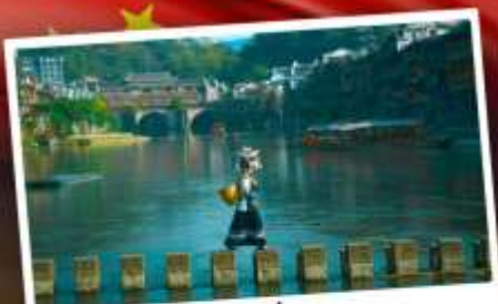
หมู่บ้านเฟิ่งทง

สุดคุ้ม!! พัก 5 ดาว ทุกคืน มนตร์เสน่ห์เมืองเก่า ริมสาងน้ำแจ่มใสแดน