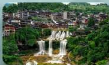
หมู่บ้านฟุทงเจิ้น