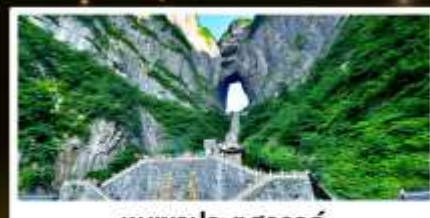
หุบเขาประตูสวรรค์