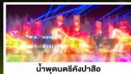
น้ำพุดนตรีคังปาสือ