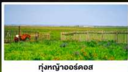
ทุ่งหญ้าออร์ดอส