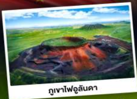
ภูเขาไฟอูลันดา

ท่องเที่ยวแดนแห่งทะเลทรายและทุ่งหญ้า ชมพระอาทิตย์ขึ้นทุ่งหญ้าออร์ดอส