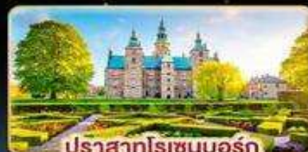
ปราสาทโรเซนบอร์ก