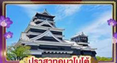
ปราสาทคุมาโมโตะ