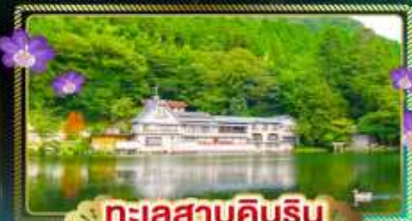
ทะเลสาบคินริน