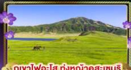
ภูเขาไฟอะโฮะ ทุ่งหญ้าคุสะเซนริ