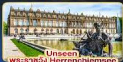
Unseen พระราชวัง Herrenchiemsee

บรรยากาศแสนโรแมนติก เส้นทางแห่งความฝัน พิชิต 2 ยอดเขา 2 ประเทศ TITLIS • ZUGSPITZE