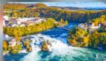
น้ำตกโรน