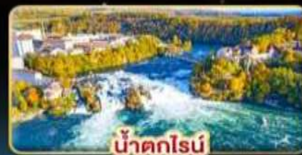
น้ำตกไรน์