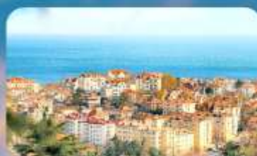
จุดชมวิว Signal Hill Park