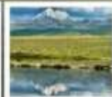
ดวงตาแห่งต้ากิง