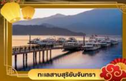
ทะเลสาบสุริยขึ้นจันทรา