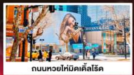
ถนนหยอไห่มีดเคิลโรด