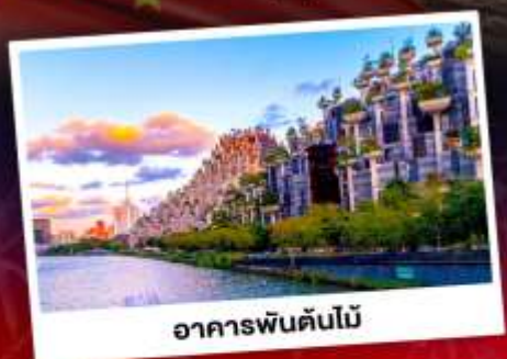
อาคารพันด้าไม้

ใกล้ชิดแพนด้าแดงแสนน่ารัก SHANGHAI WILD ANIMAL PARK ชมการแสดงพลุสุดปังที่สวนสนุกดิสนีย์แลนด์