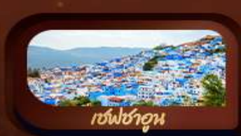
เชฟชาอูน