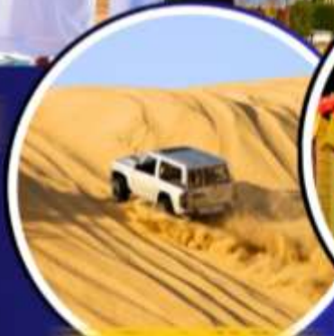
รถเช่าราย 4X4