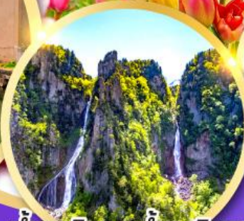
น้ำตกกิ่งกะ-น้ำตกริวเซ