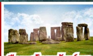
เยือนสโตนเฮนจ์ และ พิพิธภัณฑน์โรมันบาร