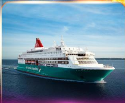
เรือสำราญ GO NORDIC CRUISE LINE