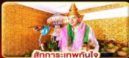
สิทธิการะเทพทันใจ